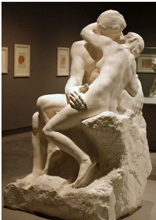
A. Rodin, La besada , 1881 (circa)

Opció A. La besada (Rodin) / La besada (Brancusi): compara les dues obres analitzant l'evolució de l'escultura contemporània