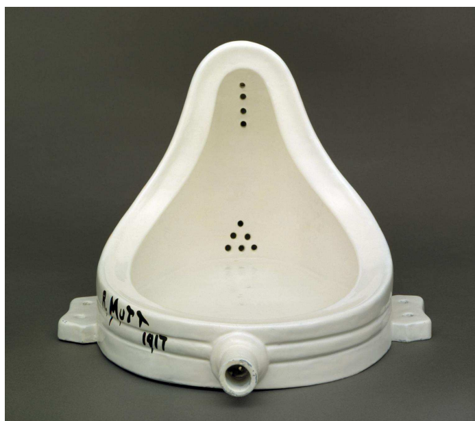
Marcel Duchamp, Font , 1917