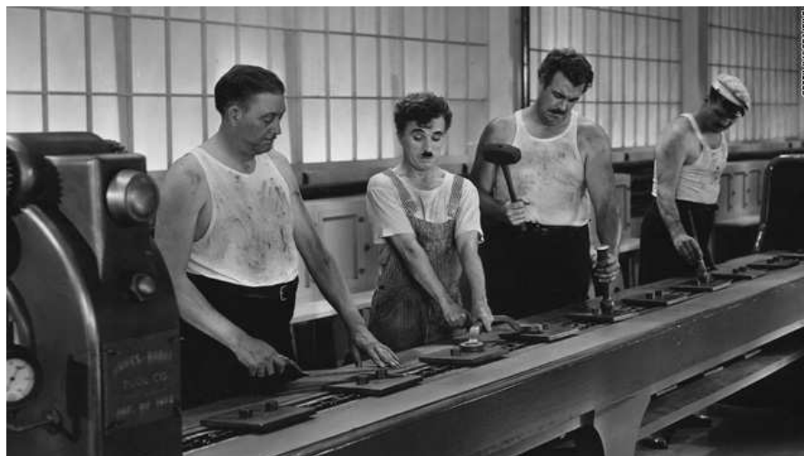
Charles Chaplin, Modern Times , 1936

Opció B. Relaciona el film de Charles Chaplin Modern Times , 1936, amb la fotografia Migrant Mother , 1936, de Dorothea Lange.