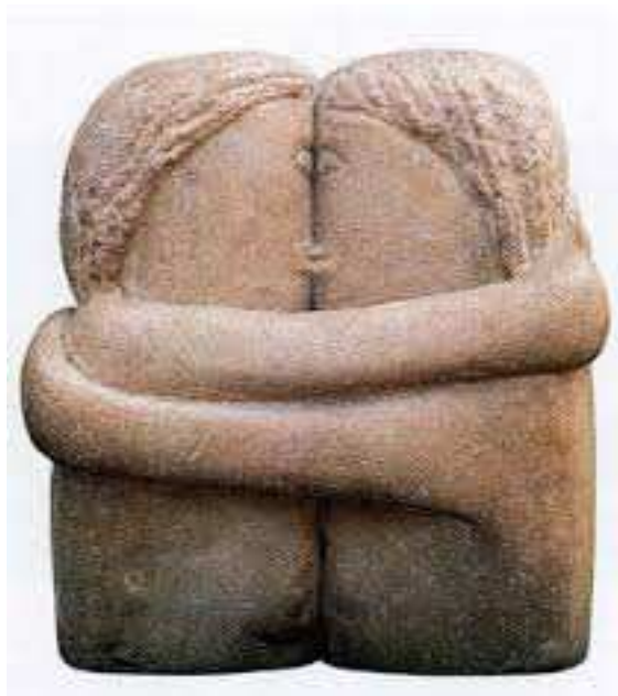
C. Brancusi, La besada , 1912