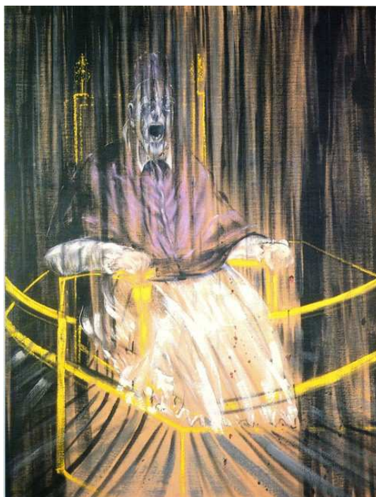
F. Bacon, El papa Innocenci X , 1953