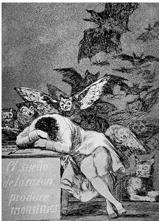
Capricho 43: El sueño de la razón produce monstruos de F. de Goya

Opció B. Relaciona aquestes dues obres: Capricho 43: El sueño de la razón produce monstruos de F. de Goya i El papa Innocenci X, 1953 , de F. Bacon.