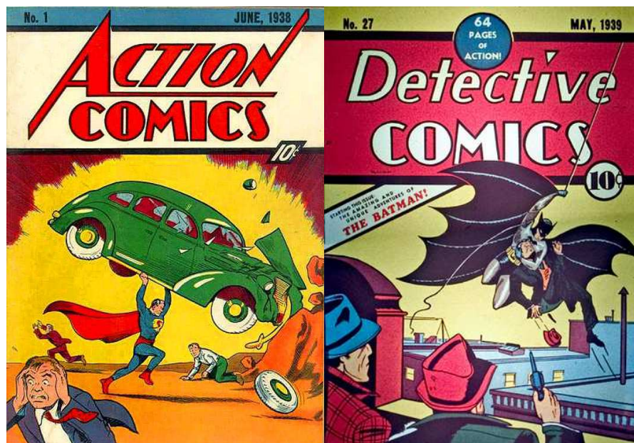
Número 1 d' Action Comics (1938) on apareix Superman, i número 1 de Detective Comics (1939) on apareix Batman