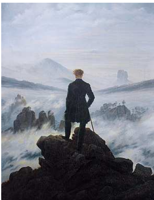
Caspar D. Friedrich, Caminant damunt un mar de boira , 1817